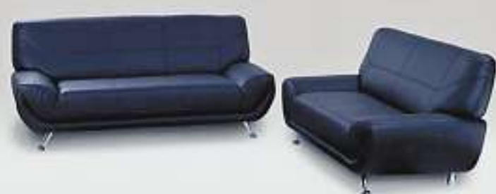
Polstergruppe Linde Textil-Leder schwarz