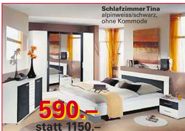
Schlafzimmer Tina alpinweiss/schwarz, ohne Kommode